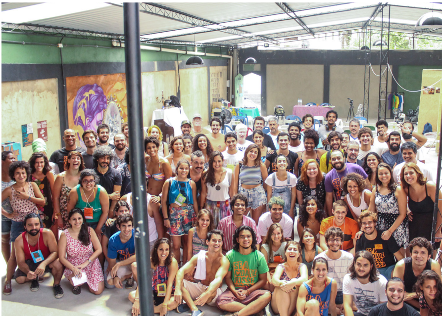
Curso de formação Se a Cidade Fosse Nossa, 2016