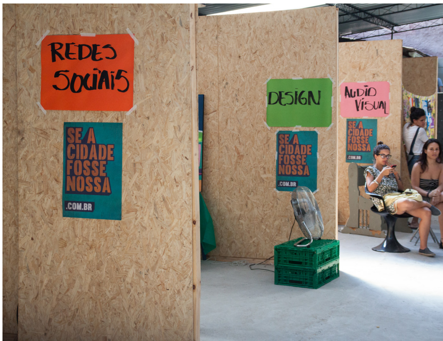
Campanha Se a Cidade Fosse Nossa, 2016

* Em todos esses o voluntário precisa responder um questionário que ajudará a campanha a ativá-los no momento certo.