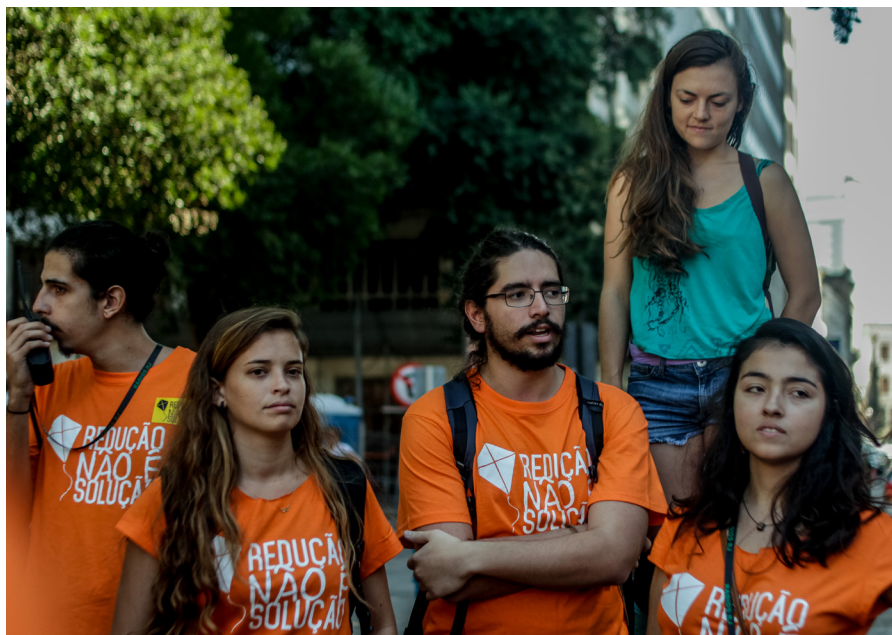
Voluntários Amanhecer Contra Redução, 2015

O voluntariado é um meio de cidadãos comuns serem ativos em causas que acreditam. A política participativa tem na essência o protagonismo de pessoas comuns na sua construção, para além do voto. O voluntariado, em uma candidatura, é não só um capital humano à disposição para ações, mas também um diferencial já na largada de qualquer candidatura, pois demarca a existência de pessoas que se identificam com o projeto em questão, a ponto de doar seu tempo e recursos, para alcançar um objetivo comum.